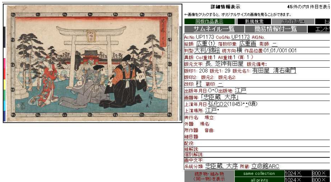
図 2. 立命館大学 ARC 所蔵 浮世絵検索閲覧システム 検索結果

図 1 は、立命館大学 ARC 所蔵 浮世絵検索閲覧システムの検索画面である。「絵師」、「彫師等」、「画題等」など、様々な項目をキーワードとして浮世絵の検索を行うことができる。利用者がキーワードを入力して検索を行うと、検索結果として該当する浮世絵の候補が提