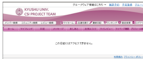
図3 検索結果から、アクセス権限のないものをクリックした時には、当該コンテンツへアクセスできない旨表示される。